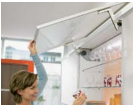
AVENTOS HS, KAAPIN YLI TAITTUVILLE OVILLE

Käytännöllinen mekanismi päällekkäin sijoitetuille tai upotetuille seinäkaapeille. Sopii mainiosti erityisesti mataliin kaappeihin.