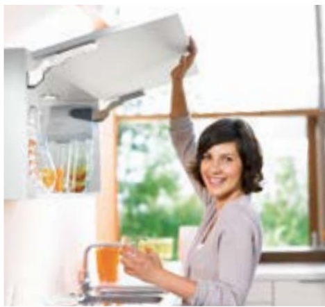
AVENTOS HK, YLÖS AVAUTUVILLE OVILLE

Ihanteellinen valinta korkeille rungoille, koska vedin jää aina alas helposti tavoiteltavalle korkeudelle. Kaksiosaisen oven ansiosta tilantarve kaapin yläpuolella on varsin pieni rungon korkeuteen nähden. AVENTOS HF- mekanismia voidaan käyttää myös kahden erikorkuisen oven kanssa.