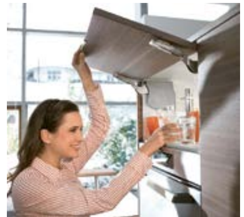
AVENTOS HK-S, PIENILLE YLÖS AVAUTUVILLE OVILLE

Käytännöllinen mekanismi päällekkäin sijoitetuille tai upotetuille seinäkaapeille. Toimiva ratkaisu etenkin matalille seinäkaapeille.