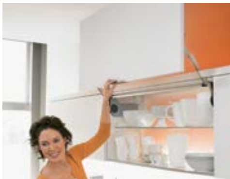
AVENTOS HL, SUORAAN YLÖS NOUSEVILLE OVILLE

Hyvä vaihtoehto pienille ylös avautuville oville esimerkiksi apteekkimekanismin tai jääkaapin yläpuolelle. Avautumiskulmansa ansiosta mekanismi vaatii hyvin vähän tilaa kaapin yläpuolella.