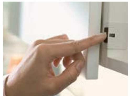
SERVO-DRIVE, MOOTTOROITU MEKANISMI

Sopii suurille seinäkaapeille, joissa on yksi iso ovi. Kätevän taittumismekanismin ansiosta tilantarve kaapin yläpuolella ei ole suuri.